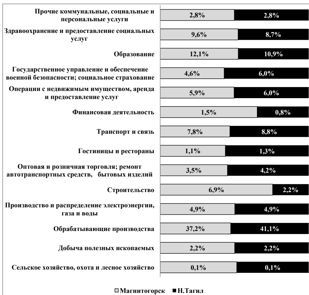
Рис. 1. Структура занятости населения в Нижнем Тагиле и Магнитогорске, 2014, % Рассчитано по: [25]

бразующих предприятий в интегрированные корпоративные структуры, а с другой стороны – от неравенства возможностей для формирования крупногородских агломераций.